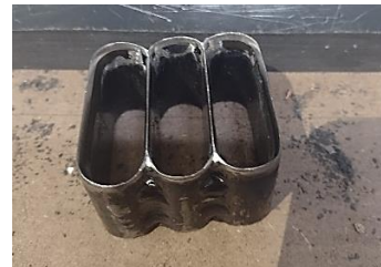
REFUERZO CHICO (Caretas y Guantes)