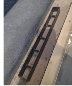
LONA PARA ESPINILLERA